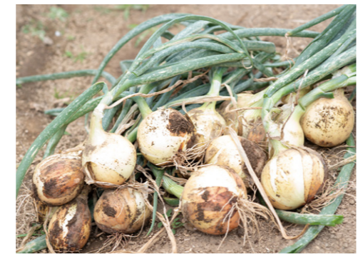
(写真上) 人権擁護委員の活動に関わる人たちとは、笑い合える関係性 (写真中) 米作り体験に田んぼを提供。体験後にご飯を残さなくなった子ども (写真下) 甘さが自慢のタマネギ。畑仕事は愛おしい作業