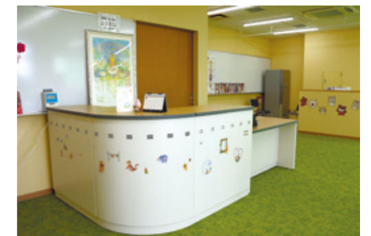
入って正面の窓口で受け付け