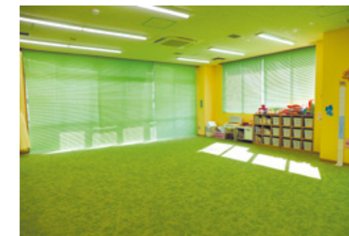
床は芝生をイメージ。光が差し込む明るい空間