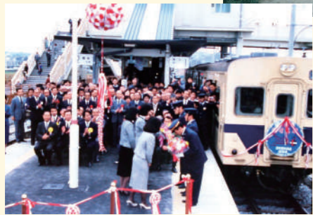
国鉄相模線海老名駅開業(昭和62(1987)年3月)