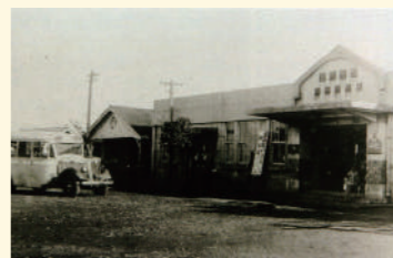
旧厚木駅(昭和14(1939)年頃)

大正15(1926)年、神中鉄道の開通とともに「二俣川〜厚木(海老名村河原口)間」の終着駅として、市域で最初に開設された駅です。同年7月には相模鉄道が延伸し、河原口でつながりました。当時は知名度のない「河原口」よりも、県央で栄えていた「厚木」を駅名にしたほうが集客が増えると考え、厚木町へ理解を求めました。厚木町も路線を計画していたものの実現は難しく、厚木町の玄関駅として「厚木」を駅名としたとされます。