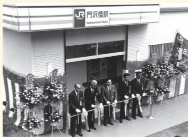
門沢橋駅駅舎完成(平成7(1995)年4月)

昭和6(1931)年に「門沢橋停留場」として開設されました。平成7(1995)年に駅舎が完成し、駅員のいる駅となり、JR東日本初の店舗が駅舎内に併設されました。現在は閉店し、無人駅に戻っています。