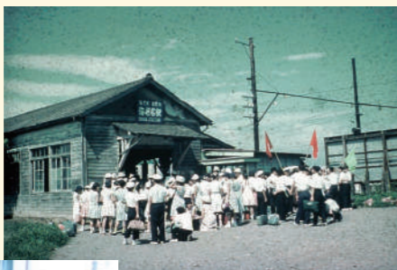
旧海老名駅(昭和32(1957)年頃)