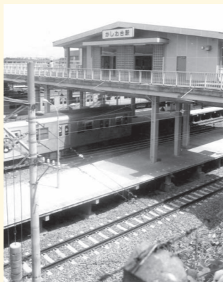
かしわ台駅(昭和50(1975)年8月)

「かしわ台駅」は昭和50(1975)年に現在の場所に開設されました。「さがみ野駅」は旧大塚本町駅が890m横浜側に移動してできました。大塚本町駅の駅名はなくなりましたが、現在はかしわ台駅東口として利用され、長い構内通路に当時の面影を残しています。