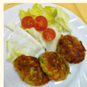
野菜のさつま揚げ風

料理レシピ掲載サイト「クックパッド」に、市栄養士・管理栄養士や食生活改善推進団体えびな会が考案したレシピを随時掲載します。