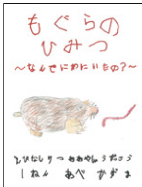
阿部和馬(大谷小1年) 「もぐらのひみつ ～なんでにわにいたの?～」