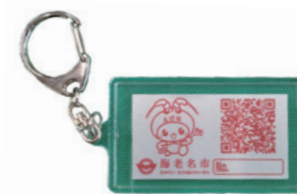
シールをキーホルダーなどにして身に着ける

情報を登録することで行方不明となった際の早期発見につながるネットワークです。登録者には目印となる二次元コード付きシールを配布します。認知症による損害を補償する保険付きです。