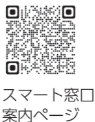
スマート窓口 案内ページ

「スマート窓口」は、氏名などの情報をスマートフォンやパソコンなどから事前入力できる手続きです。住民票の取得や転出・転居などの手続きに加え、3月11日(月)からは福祉に関する手続きに対応します。手続きの一覧は市ホームページをご覧ください。