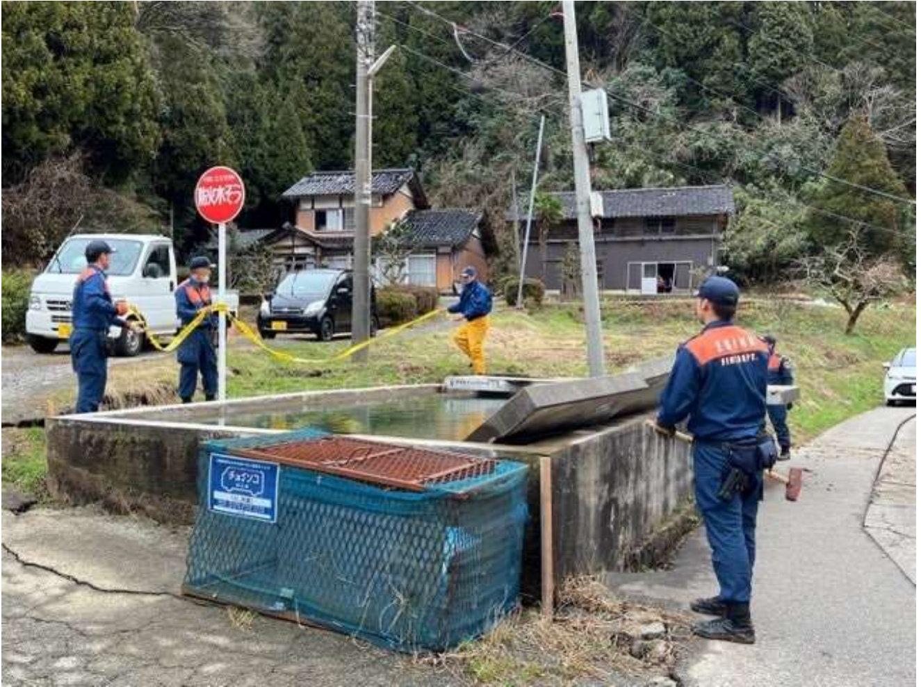
被災消防本部の支援活動の様子（土砂ダム巡回）