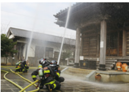
龍峰寺で行った訓練の様子

市内の文化財を火災などから守り、遺していくため、「文化財周辺でたき火や喫煙をしない」「文化財周辺にごみを捨てない、燃えやすい物を置かない」など、ご理解とご協力をお願いします。市は文化財防火デーにちなみ、1月24日(水)10時15分～11時に豊受大神(杉久保北2-22-1)で消防訓練を行います。