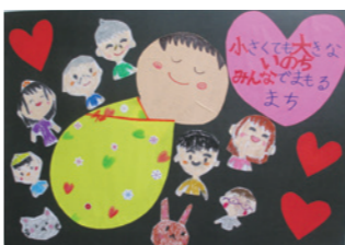
令和5年度優良作品

『平和なまち』をテーマに描いた子どもたちの絵とメッセージを展示します。 期12月11日(月)～15日(金)(最終日は12時まで) 閩市役所エントランスホール