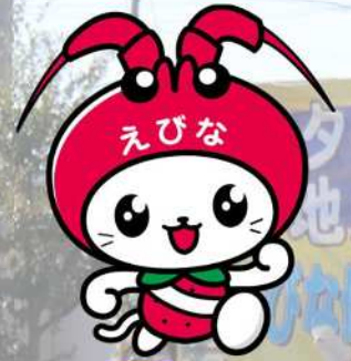
海老名市イメージキャラクター 「えび～にゃ」