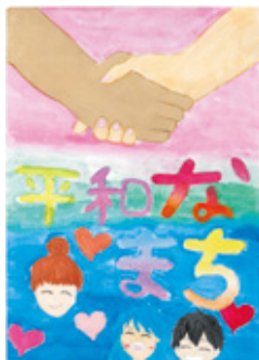
令和4年度応募作品

▶規格・点数 B4または八つ切り画用紙・1人1点 ☎市内在住・在学の6歳～15歳の方(令和5年11月1日時点) ☎「私にとっての平和」をテーマに描いた絵 ☎応募用紙を作品の裏面に貼付し、郵送または直接市民相談課へ。用紙は市ホームページからダウンロード可。9月4日(月)締め切り(必着) ☎応募作品から市が選定し、平和首長会議の絵画コンテストに提出します