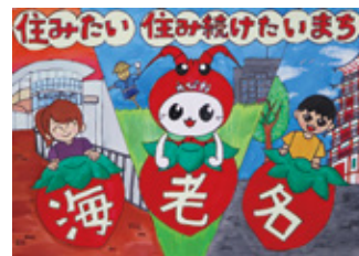
令和4年度応募作品

▶規格・点数 四つ切り画用紙(ヨコ)・1人1点 ☎市内在住・在学の小学生 ☎風景・人・物などの「えびなの好きなところ」を描いた絵に、「住みたい 住み続けたいまち 海老名」(ひらがな可)の文字を入れた作品 ☎作品裏面に応募票を貼付し、市立小学生は夏休みの課題提出日に学校へ提出。他の小学生は郵送または直接シティプロモーション課へ。応募票は同課で配布のほか、市ホームページからダウンロード可。9月4日(月)締め切り(必着) ☎応募作品は市の事業やPRに活用します。応募者に参加賞を贈呈します