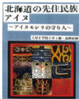
令和4年度市長賞作品

▶規格 50 ページ 以内 ☎市内在住・在学の小・中学生 ☎自分で見つけた疑問を図書館で調べ、画用紙やレポート用紙、模造紙などにまとめた作品 ☎作品に利用した資料名と図書館名を記入し、応募シートを添え、小学生はB4・中学生はA4までのサイズに折り畳んで提出。市立小・中学生は夏休みの課題提出日に学校へ、他の小・中学生は、郵送または直接有馬図書館へ。応募シートは中央・有馬図書館で配布。9月20日(水)締め切り(必着) ☎優秀作品は全国コンクールに提出します。詳細は、有馬図書館(☎238・4646)へお問い合わせください