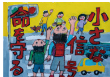
令和4年度小学校6年生の部最優秀賞作品

▶規格・点数 四つ切り画用紙・1人1点 ☎市内在住・在学の小学生 ☎「交通安全」または「防犯」をテーマに描いた絵 ☎作品裏面に応募票を貼付し、市立小学生は学校へ提出。他の小学生は直接地域づくり課へ。応募票は同課で配布のほか、市ホームページからダウンロード可。8月30日(水)締め切り ☎優秀作品は、10月28日(土)の「えびな安全・安心フェスティバル」で表彰します