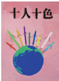
令和4年度応募作品

▶規格・点数 四つ切り画用紙・1人1点 ☎市内在学の中学生 ☎「人権の共存」「いじめのない楽しい学校生活」「あらゆる差別のない社会の実現」など人権尊重をテーマに描いた絵 ☎夏休みの課題提出日に学校へ提出