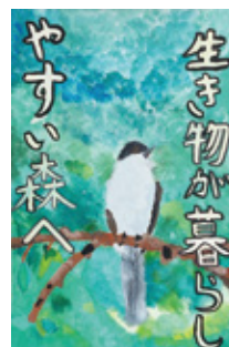
令和4年度小学校高学年の部金賞作品

▶規格・点数 四つ切り画用紙・1人1点 ☎市内在住・在学の小学生 ☎「みどりを大切に!」をテーマに描いた絵 ☎市立小学生は夏休みの課題提出日に学校へ提出。他の小学生は、郵送または直接都市施設公園課へ。9月1日(金)締め切り(必着) ☎入賞作品は、市役所エントランスホールに展示します