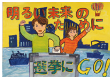
令和4年度小学校高学年の部金賞作品

▶規格・点数 四つ切りか八つ切り画用紙、またはこれに準じる大きさの画用紙・1人1点 ☎市内在住・在学の小・中学生 ☎「明るい選挙を呼びかけること」をテーマに描いた絵 ☎市立小・中学生は夏休みの課題提出日に学校へ提出。他の小・中学生は、直接選挙管理委員会事務局へ。9月8日(金)締め切り ☎全作品を、県の「明るい選挙啓発ポスターコンクール」に応募します