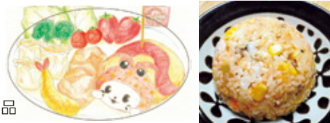
令和4年度市長賞作品

☎市内在住・在学の小・中学生、市内在学の高校生 ☎【絵画・イラスト部門】給食で食べてみたい献立の絵【レシピ部門】給食で食べてみたい主菜・副菜・汁物・デザートのうち1品のレシピと調理写真 ☎市立小・中学生は夏休みの課題提出日に学校へ提出。他の小・中学生と市内高校在学学生は、郵送または直接就学支援課へ。応募用紙は市ホームページからダウンロード可。9月8日(金)締め切り(消印有効) ☎レシピ部門の優秀作品は給食献立として検討します。全部門の優秀作品は市役所エントランスホールに展示。応募者に参加賞を贈呈します