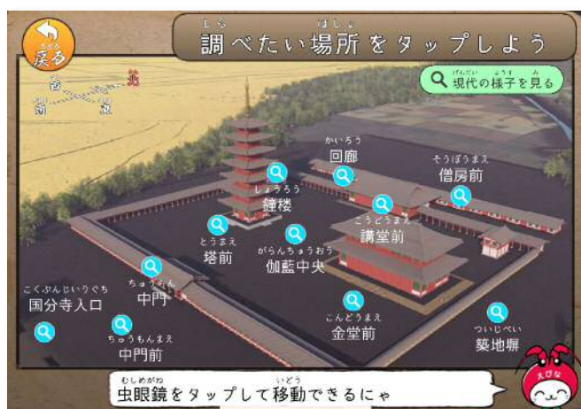
相模国分寺 360 画面