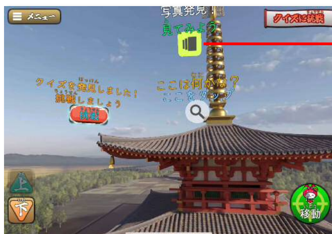
解説、クイズもあります