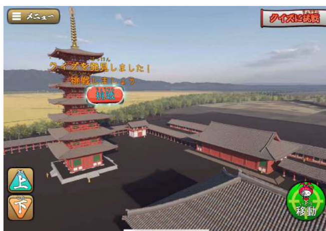
360 度の景観を見ることができます