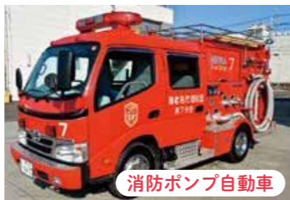
消防ポンプ自動車

大規模災害や河川敷火災など、消防ポンプ自動車だけの対応が難しい状況を想定した設備です。