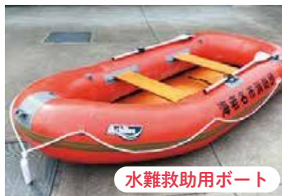
水難救助用ボート

水害発生時に地域住民の避難補助ができるよう、市の防災備蓄倉庫などで7艇保管しています。