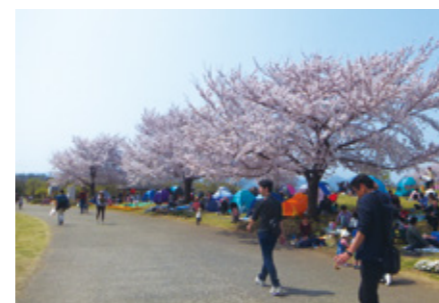
安谷屋さんが撮影したサクラの風景写真。どんな時も感性が赴くままに