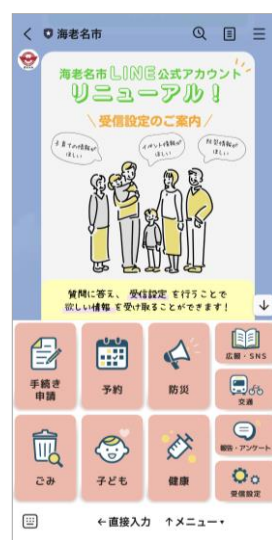
▲市LINE公式アカウント「海老名市」