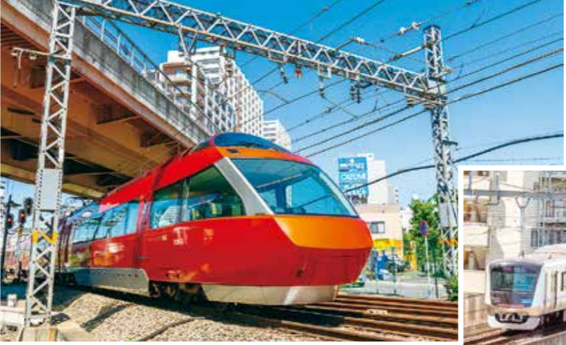
小田急ロマンスカー