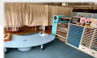
別室教室のイメージ

不登校または不登校傾向の児童生徒に対して、ICT学習ツールを活用し学習機会を保障します。また各小学校内の別室教室の支援員の充実及び心のケア等を実施します。