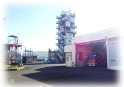
消防署南分署のイメージ

老朽化した南分署の移転・建替により、災害に強い頑強な庁舎とすることで、迅速確実な出動体制を構築し、「安全・安心なまち」を維持し続ける消防体制を目指します。