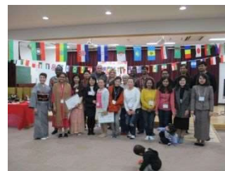
国際化事業のイメージ

外国籍住民アンケート調査や国際窓口の設置を行い、市内在住の外国籍住民が安心して生活していくことができるように、多文化共生事業を進めます。