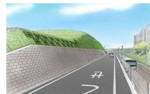
道路斜面補強イメージ

道路脇、斜面の崩落に伴う事故を未然に防止し、道路確保を図るため、国分北三丁目地内の市道3号線の道路斜面安全対策を実施します。