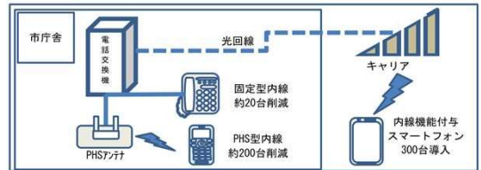
スマートフォン導入の実施予定イメージ

海老名市公共施設再編（適正化）計画について、現計画の実績等の既存資料の時点修正のほか、社会環境や財政状況の変化及び総務省の策定指針の見直しを踏まえた改定を行います。