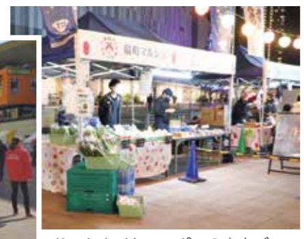
おでんナイトニッポンの直売ブース