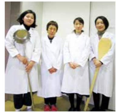
海老名市食の創造館栄養士

学校給食での海老名産産物の使用について海老名市食の創造館の栄養士に聞きました。旬の食材を使うことを大切にしています。イチゴは1月、トマトは5月、ダイコンやキャベツなどは秋に使用しています。もちろん主食のコメも海老名産産物です。「地元の食材を食べる」ことは食育にもなります。子どもたちには海老名産産物を食べてすくすく育ってほしいと思います。