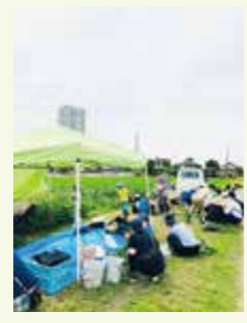
エダマメの収穫体験