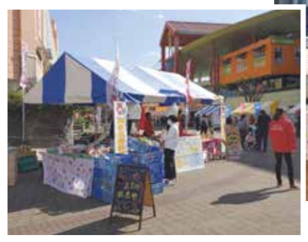
えびな安全・安心フェスティバルの直売ブース