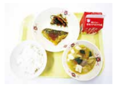
昨年12月の献立にハクサイ、ダイコン、ネギを使用