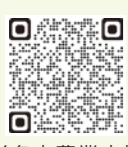
海老名市農業支援センターホームページ

法人活動の一環として農産物の収穫体験イベントを催すほか、農家と市内店舗のマッチングなどに取り組んでいます。詳細は、海老名市農業支援センターホームページをご覧ください。