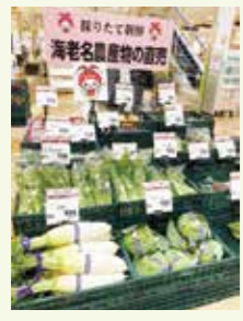
大型店舗での直売会