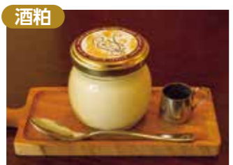
酒粕 六代目プリン Re Cafe 河原口1-27-14