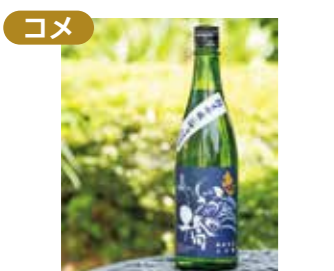
コメ いづみ橋 恵 純米吟醸 青ラベル 泉橋酒造(株) 下今泉5-5-1