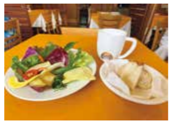
新鮮な海老名産野菜を使用した「バーニャカウダ」 タベルナイル ロカール 中野3-16-20