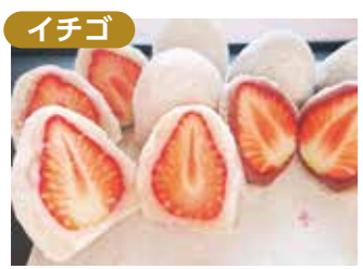
イチゴ いちご大福 御菓子司 山口屋 中野3-30-9