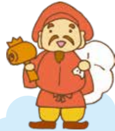
大黒天(妙元寺) 大谷南3-29-16