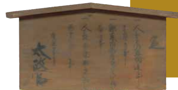
「五榜の掲示」第一札

明治時代を前に、新政府の方針を民衆に発した「五榜の掲示」。内容は、江戸幕府の方針とあまり変わらないものでした。