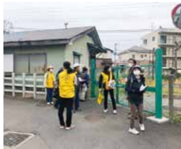
健康えびな普及員会主催のウォーキングの様子