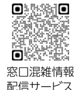
窓口混雑情報配信サービス