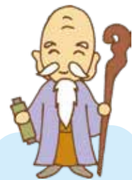
福祿寿(増全寺) 中新田2-15-36