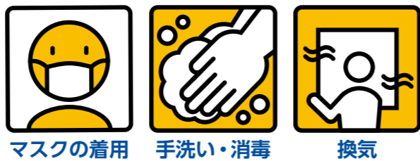
マスクの着用 手洗い・消毒 換気