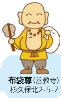
布袋尊(善教寺) 杉久保北2-5-7