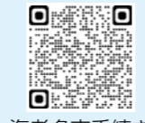
海老名市手続き案内サービス

STEP 1 スマートフォンやタブレット、パソコンで「海老名市手続き案内サービス」※にアクセス