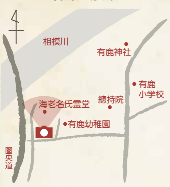
海老名氏霊堂入り口から撮影