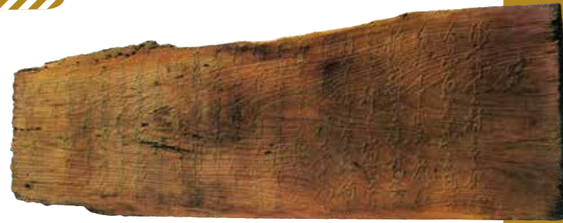
画像：「正覚寺誌」引用

門沢橋村の領主から出された浪人取り締まりの高札。「面倒を起こす者は召し捕らえて役所に差し出すように」という内容です。門沢橋村に伝わる江戸期唯一の高札です。