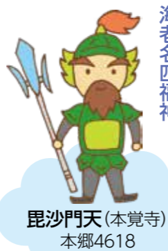
毘沙門天(本覚寺) 本郷4618