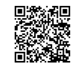
人権作文入賞 作品掲載ページ

日 日時・日にち 期 期間 時 時間 場 場所 対 対象 定 定員 内 内容 講 講師 費 費用 持 持ち物 他 その他 任 任期 条 条件 主 主催 E Eメール HP ホームページ 問 問い合わせ 申 申し込み 予 予約制 祝 祝日を除く 休 休み 高 高齢者対象の教室など 健 健康 えびな健康マイレージ対象 市 市役所開庁時間…省略している場合は原則「月~(金)8時30分~17時15分」 年 年末年始の開庁日…12月29日~1月3日