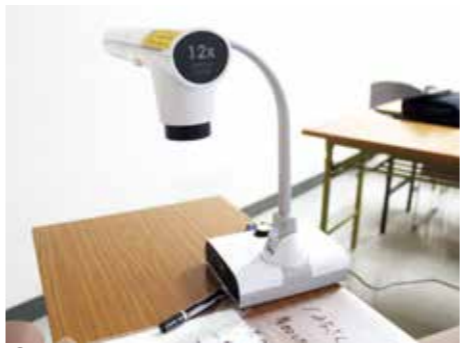
② OHC(オーバーヘッドカメラ)