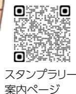
スタンプラリー案内ページ