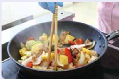
「夏野菜と豚ばら肉のカレー炒め」。夏バテ対策など季節に合わせた献立も考案しています

栄養バランスの良い献立作りや、生活習慣病予防・フレイル予防のための健康的な食生活を広めます。