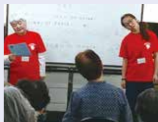
中新田で出張講座

体力測定会や体操教室、ウォーキングイベントなど、健康維持・増進を広める活動をします。派遣要請を受けて出張講座をすることもあります。