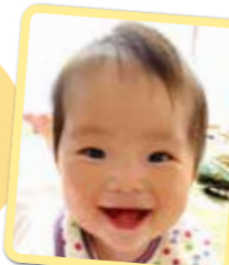
りょうちゃん いつもニコニコ 笑顔が大好き♡