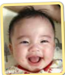
さらちゃん いつも笑顔! 元気いっぱい 育ってね