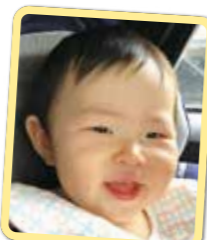
やまと 大和ちゃん いつもここにこ お姉ちゃんたちが大好き!