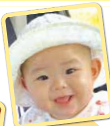
こじゅうろうちゃん いつもニコニコ 元気いっぱい! 大きくなあれ!