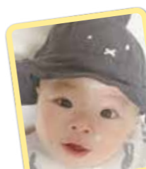
かえでちゃん 寝返りできたよ! キメ顔でにっこり