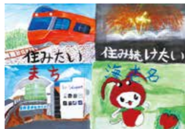
令和3年度応募作品

☑市内在住・在学の小学生 ☑風景・人・物などの「えびなの好きなところ」を描いた絵に、「住みたい 住み続けたいまち 海老名」(ひらがな可)の文字を入れた作品 ☑作品裏面に応募票を貼付し、市立小学生は夏休みの課題提出日に学校へ提出。他の小学生は、郵送または直接シティプロモーション課へ。応募票は同課で配布のほか、市ホームページからダウンロード可。9月5日(月)締め切り(必着) ☑応募作品は市の事業やPRに活用します。応募者に参加賞を贈呈します