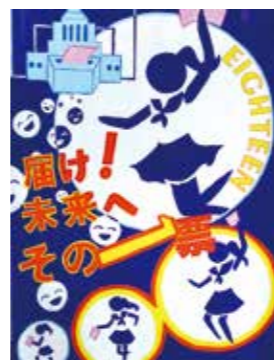
令和3年度 小学校高学年の部 金賞作品

☑市内在住・在学の小・中学生 ☑「明るい選挙を呼びかけること」をテーマにした絵 ☑市立小・中学生は夏休みの課題提出日に学校へ提出。他の小・中学生は、直接選挙管理委員会事務局へ。9月9日(金)締め切り ☑全応募作品を「神奈川県明るい選挙啓発ポスターコンクール」に提出します