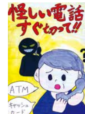
令和3年度 小学校6年生の部 最優秀作品

☑市内在住・在学の小学生 ☑「交通安全」または「防犯」をテーマに描いた絵 ☑作品裏面に応募票を貼付し、市立小学生は学校へ提出。他の小学生は直接地域づくり課へ。応募票は同課で配布のほか、市ホームページからダウンロード可。8月30日(火)締め切り ☑優秀作品は、10月29日(土)の「えびな安全・安心フェスティバル」で表彰します