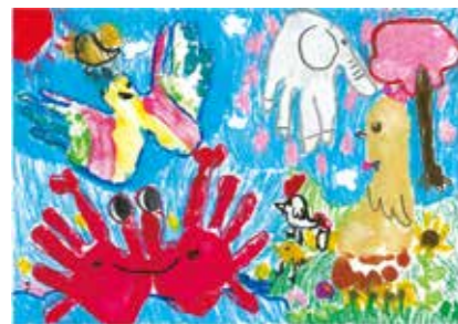
令和3年度応募作品

☑市内在住の6歳～15歳の方(10月31日時点) ☑「平和なまち」をテーマに描いた絵 ☑作品裏面に応募申込書を貼付し、郵送または直接市民相談課へ。用紙は市ホームページからダウンロード可。9月7日(水)締め切り(必着) ☑応募作品から市が選定し、平和首長会議の絵画コンテストに提出します