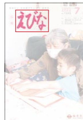
優秀作品は「広報えびな」の タイトルロゴに採用

☑市内在住・在学の小学校4年生 ☑半紙の上半分に毛筆で横書きした「えびな」の文字 ☑半紙の下半分に応募票を貼付し、市立小学生は夏休みの課題提出日に学校へ提出。他の小学生は、郵送または直接シティプロモーション課へ。応募票は市ホームページからダウンロード可。9月5日(月)締め切り(必着) ☑応募作品は返却しません