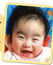
ゆずきちゃん いつも笑顔の ゆずちゃん だいすきだよ!