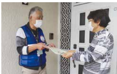
民生委員の見守り活動では表情を見ながら優しい言葉を