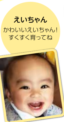
かいちゃん かわいいかいちゃん! すくすく育ってね