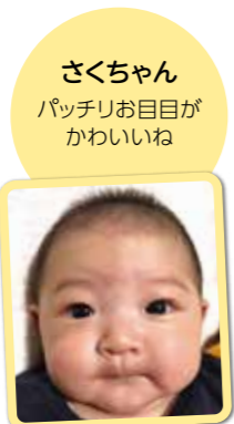
さくちゃん パッチリお目目が かわいいね