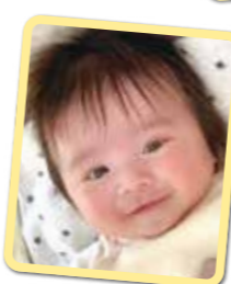
めっちゃん ニコニコ笑顔 元気いっぱい 育ってね