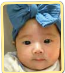
ひなちゃん お兄犬と仲良し♡ 家族みんなの たからものだよ♡