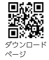
ダウンロードページ

【応募方法】 応募用紙とCD-RまたはDVD-Rに入れた写真データを、郵送または直接シテイプローモーション課へ。市ホームページから可。用紙は同課で配布のほか、ホームページからダウンロードできます。9月30日(金)締め切り 【応募点数】 1人5点まで(被写体が異なるもの) 【規格】 JPEG形式のデジタルデータで1作品2メガ以上を目安とする 【応募条件】 ①過去3年以内に市内で撮影した未発表のカラー写真②組み写真や合成処理を施していない③著作権は応募者に帰属するが、市が応募写真の複製・加工・編集を行い、無償かつ自由に使う権利を有することに了承する