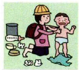
きょうだいの世話