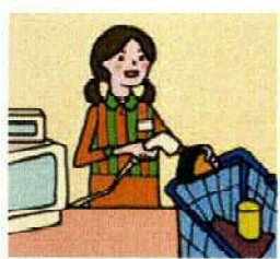
バイトで家計を支える