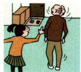
声かけ・気づかい