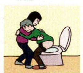
かいご 家族の介護

(Illustration : Izumi Shiga)