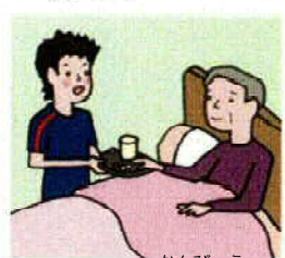
かんびょう 家族の看病