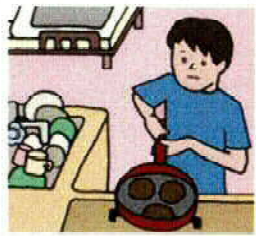
買い物・料理・そうじ