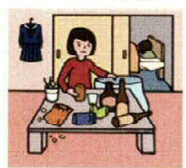
アルコール、薬物をする 家族の世話