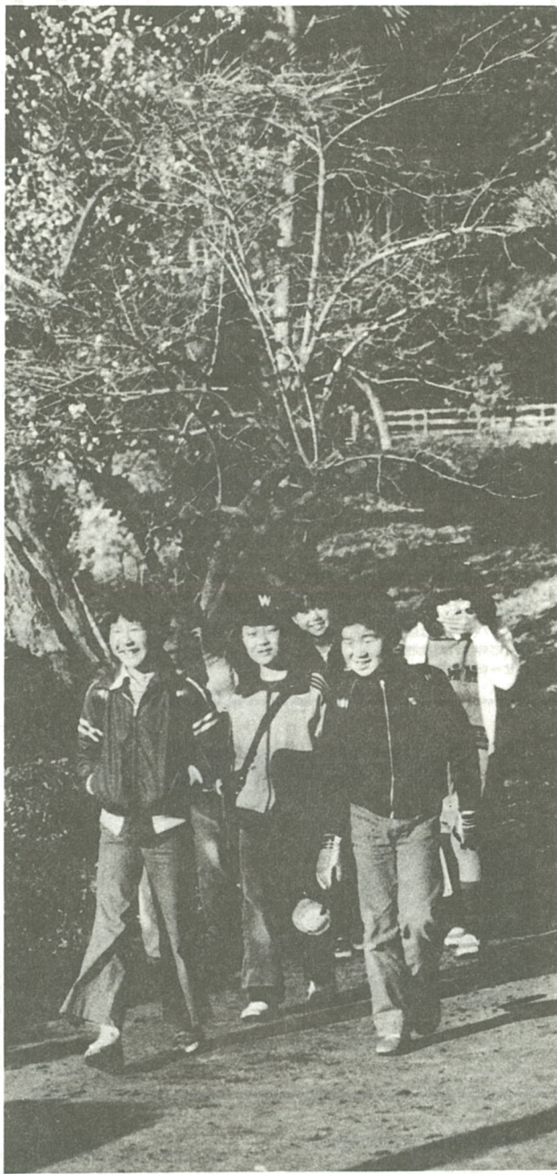
ぼくらの新しい小学校ができるんだって(杉本小付近)