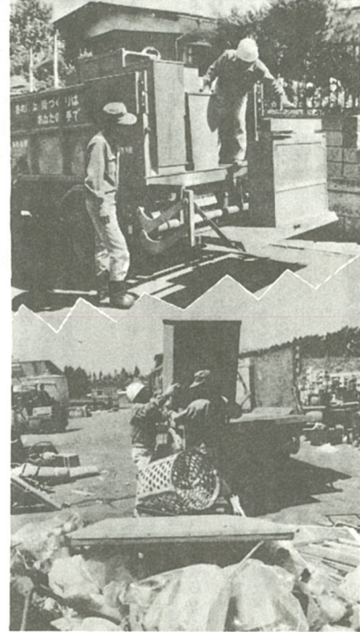
粗大ゴミは有料(1品500円)であなただけまで収集に

消費生活の拡大から生じるさまざまなゴミは、人口の増加 もあって、当市では毎年一千ト位ずつ増加しています。これ らのゴミをスムーズに収集処分するために、市では、3分別 収集、減量化再利用運動を実施しています。すでにこの制度 は市民のみなさんにご理解、ご協力をいただいています。し かし、他市から転入してきた新住民の方などまだこの制度に なじんでいない方が、間違って粗大ゴミをゴミ集積所に出す 場合などがあります。これから年末にかけて大掃除などでゴ ミがたくさん出てきます。そこで、ゴミの出し方をここで紹 介し、さらに市民のみなさんのご協力をお願いします。 現在、市では、市民の日常生活から排出されるゴミを、①可 燃ゴミ ②不燃ゴミ ③粗大ゴ ミの三つに分別して収集して います。それぞれのゴミの出 し方は次のようにお願いします。