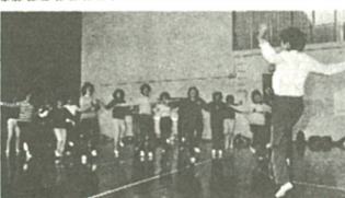
リズムに合わせてシェイプアップ

心地よい汗を流す リズム体操のこのえん 音楽のリズムに合わせてシェイプアップ。リズム体操同好会のこのえんは、日ごろの運動不足を解消するため、市母親クラブ連絡協議会を母体として、去年九月に結成されました。