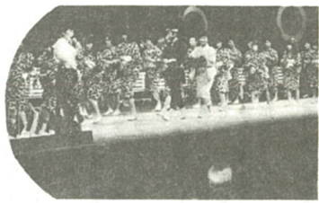
「幻想曲ささや」を発表

三月六日、神奈川県民ホールで行われた「第二回カナガワビエンナーレ国際児童画展」もフェスティバルのプログラムとして世界各国の民俗芸能が披露され、会場いっぱい詰めかけた三千人の観客を楽しませました。