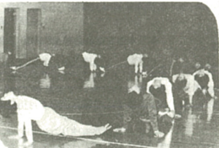
好評だった体操教室