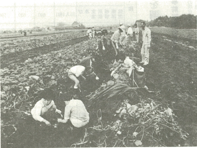
土に親しむ「土の日」を今年度から

また、子育て支援センターの整備を図るとともに、老人も対象として一時入所措置を、痴呆(痴呆)老人も対象とし、介護されている家族の方々の負担軽減を図りました。