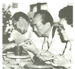
陶芸に取り組みお年寄り