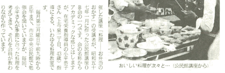
おいしい料理が次々と... (公民館講座から)