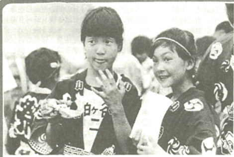
57年度アマチュア写真コンクール金賞作品

八回ふるさとまつり実行委員会(萩原松三委員長)では、多くの方々のご来場をお待ちしていますが、会場周辺の混雑が予想され、また駐車場も限られた車両台数(一般駐車場三百五十台)しか駐車できませんので、ご来場には電車・バスなどをご利用ください。 ◇問い合わせ 第八回ふるさとまつり実行委員会事務局(市役所企画調整課)