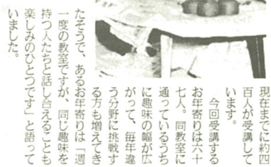
現在のまで約四百人が受講しています。

市内の六十歳以上のお年寄りを対象に、六月二十二日、市立総合福祉会館と西部福祉館で老人趣味の教室が行われました。日本画、アートフラワー、はり絵、版画、陶芸などを通して、お年寄りに創造の喜びを味わつてもらつたと昭和五十四年から始め