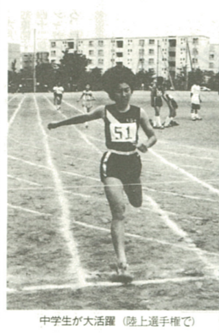
中学生が大活躍（陸上選手権で）

5月29日、海西中学校グラウンドで中学生百六十八人を含む二百十人が参加して第四回市総合体育大会陸上選手権が行われました。