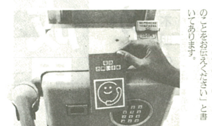
表紙がオレンジ色の手帳です

生け垣の土台は、生け垣の基礎となる。土台の高さは、土台の高さを含め、生け垣の長さより1メートル以上高くする必要がある。