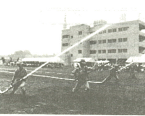
練習の成果を披露

七月二十四日、今泉小学校校庭で、市消防操法大会が行われ、第十四分団(門沢橋)が優勝しました。 市内の消防分団は十五分団あり、操法大会でも毎年優秀な成績をおさめるなど、操法技術は高い水準を保っています。今回は第十四分団が、時間、正確な技術、規律などで平均してポイントをかき、第四分団(河原口)を少差で押さえて優勝しました。