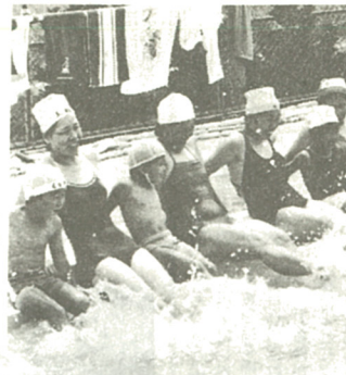
お母さんと一緒に楽しく水泳