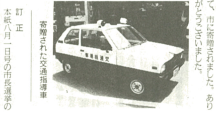
協賛された交通指導車