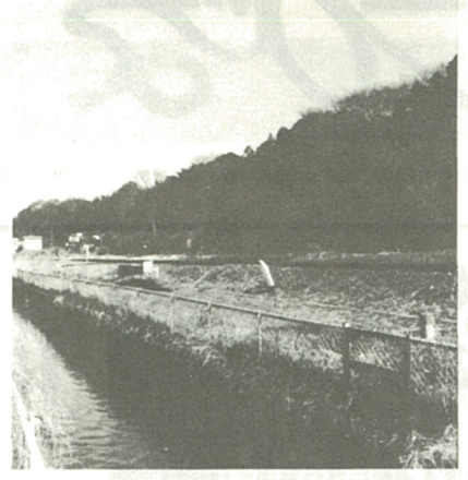
都市化で減っている市内の緑