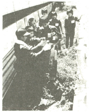
こんなに空き缶が...