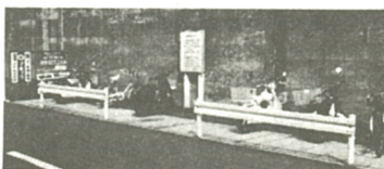
自転車置き場でも駅近く(写真右)は、通路はおろか道路上にまで自転車が出ている。一方、同じ自転車置き場でも50台も先に行けば(写真左)こんなにすいている(7月4日、厚木駅のさつき町にある自転車置き場で)。

この際、受益者負担、財政負担の軽減という考えから自転車置き場の固定用施設がある市営自転車置き場を有料化する予定です。このことに関しては、市議会で審議してから実施する予定です。