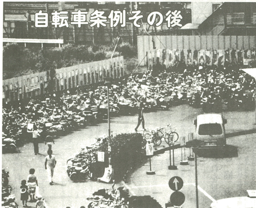
放置自転車対策の要望が多い海老名駅東口(8月4日撮影)