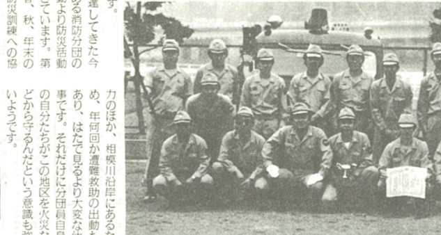
チームワークで優勝した消防十四分団

では七月に入ってから午後七時半から十時半まで、市立小中学校で延べ二百日間の練習をしました。