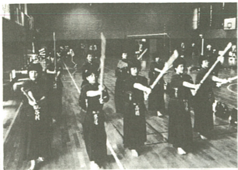
柏ヶ谷中女子剣道部 「一試一試と勝っていったらいつの間にか優勝してしまっ

お問い合わせは主催者に。主催者の都合で変更になる場合があります。10月の休館日は、4・11・18・25日です。