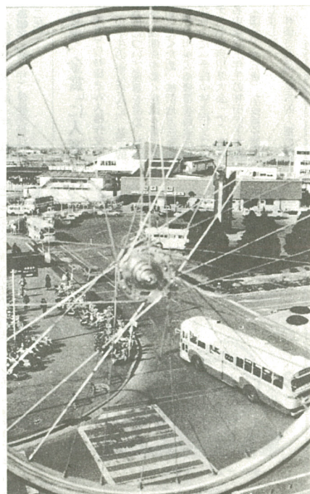
新たに自転車の放置禁止区域が設けられる海老名駅東口

一般利用は千円 同条例では、駐車料を一般月額千円、学生月額八百円とするほか、左欄の事項が定められています。管理面など細かいことは、施行規則及び運用で定めることとしています。十二月二十三日の市議会の議決を受けて、現在施行規則及び運用の整備を急いでいます。 また、海老名駅東口の自転車放置禁止区域は、今月中に放置禁止区域指定協議会(関係団体の長、各駅長、市民代表など)構成)を開き、この意見を元に市長が指定します。 これらのことは、決定次第、本紙でお知らせします。