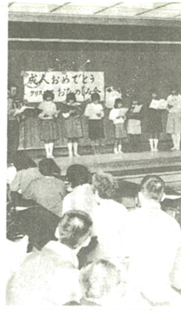
楽しい出し物がたくさん

市消防本部では、市内各所で消火器の取り扱い方説明と消火訓練を左表のとおり行います。