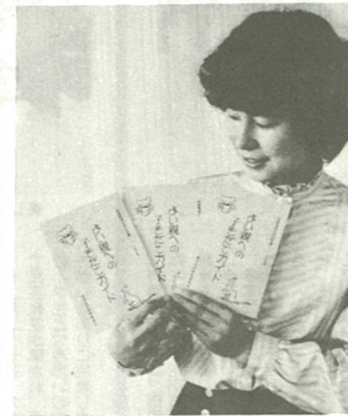
市教委で有料頒布する「よい親への子そだてガイド」

市教育委員会社会教育課では、小学生を持つ親を対象とした「よい親への子そだてガイド」を、よい親へのガイドとして、今年14日から1月31日まで、一般に有料頒布されている。