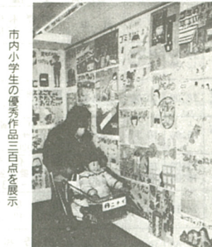
市内小学生の優秀作品三百点を展示