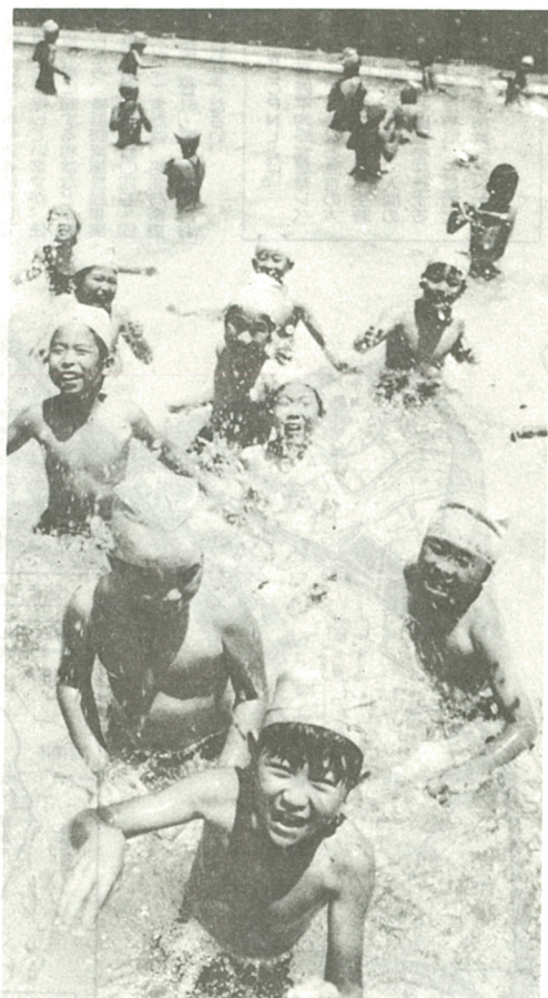
今年も元気に泳ぐぞ(有馬小プールで)