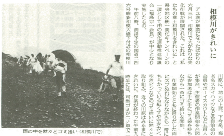
雨の中を黙々とゴミ拾い(相模川で)