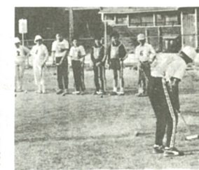
交流も兼ねてゲームを楽しむ