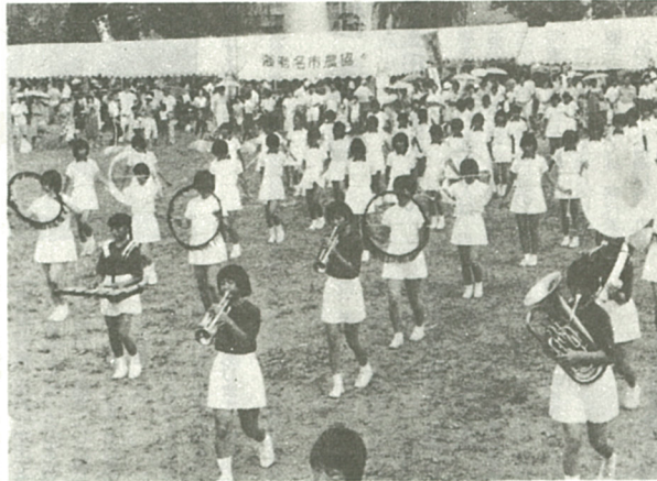
大谷中生徒によるドリル演奏とバントワラー

◇バントワラー 両日とも、柏ヶ谷中学校と大谷中学校バントワラー部による演技があります。大谷中の演技は同中フラスバンド部がドリル演奏します。 ◇カラオケ大会・歌謡ショー 十九日、あさひのぼるの司会によるカラオケ大会(リタターレコーナー) ◇フラスバンド 海老名市消防音楽隊と初参加の有馬高校フラスバンド部による演奏があります。消防音楽隊は十八日のみ、有馬高校は両日、演奏します。