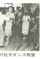
毎回大好評の社交ダンス教室

シルバヤマンボのリズムに乗って心身ともに若返ろうと、八月二十三日までの毎週木曜日、市総合福祉会館でお年寄りの「社交ダンス教室」が開かれた。