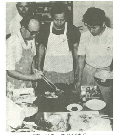
衣。はあっさりつけて

とき・10月7日(日)正午から1回公演/ところ・市文化会館/入場料・前売2,000円、当日2,500円(全席指定)団体割引あり。