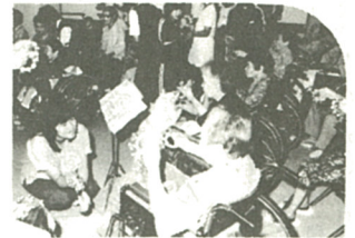
器楽演奏で若年寄りと交流