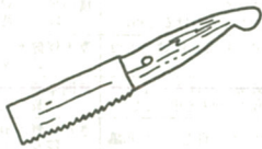
当時使われたと思われる横ひきノコギリ

も見せしめのため、実際に竹の鍔でひいたものではない。これらの時代的な違いや、刑具や制度などの矛盾を承知の上で、どうして息が立たないことになりつづけるならば、尼寺の焼失と本尊の焼滅を悲しんだ尼僧が、焼跡に立つて朝多めに涙に濡れたたてずれば史実や律との矛盾は解決する。