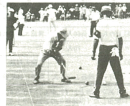
市内各地から五十チームが参加