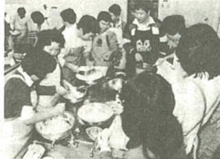
楽しげに、くず汁の塩かけはんは!