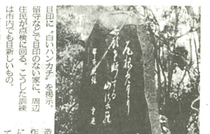
自然をうたった句碑と雪窓さん