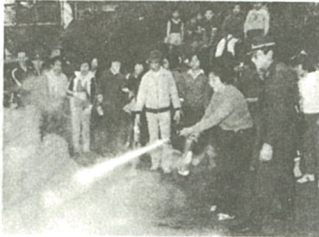
この経験で、もつたい、じょうぶ!

た簡単な料理」をねらって、豚肉の炊き込みごはん、はんぺんと野菜のくず汁、かぼち天根の甘酢、家族で料理をする人もいれば、まったく初めての人もいて「塩かけはんは、火かけはんは」とにぎやかに楽しそうにみんなを料理に取り組んだ。