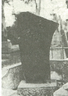
子とともたぎらひよって建てられた白帆先生の句碑

崎小を振り出しに有馬小を経て郷里の海老名小学校へ転任、長らく河原口分校で勤務に勤められたが、大正九年本校へ勤務替になられた。