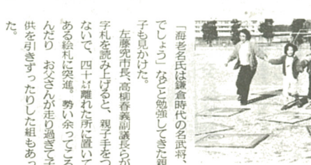
目的のカルタめざして走る