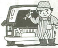
入らせていただきます。この協力をお願いします。なお、ご不審の点がある場合は、建設課(内務)または用地課(内切)へお問い合わせください。

県内勤労者の賃金を保障する最低賃金が、神奈川県地方最低賃金審議会の審議を経て、下の通り改正されました。 事業者は最低賃金の適用を受ける勤労者(パートタイム、アルバイト、臨時工を含む)に対して最低賃金以上の賃金を支払うと共に、雇員名簿の提出を義務づけられています。 また、今回の改正で十八歳未満及び六十五歳以上の全ての労働者は、最低賃金を適用するとはなりません。