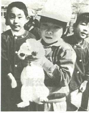
子供は明るくすこやかに

六月一日から、児童手当が改正されます。現在、十八歳未満の児童(一人以上)に支給されており、そのうち一人以上が義務教育終了前八歳未満の児童を一人以上養育している場合は、一人目の子供にも支給されます。これは昭和五十九年六月二日以前に生まれた児童を含む十八歳未満の児童を一人以上養育している場合は、一人目の子供にも支給されます。