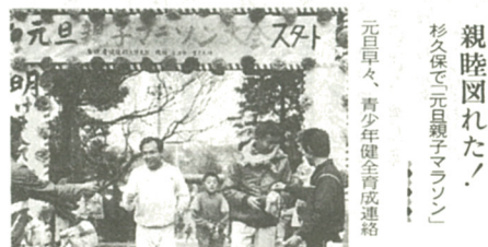
親睦図れた! 杉久保で元百親子マラソン