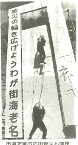
市消防署の応用登はん演技