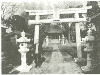
筆者(写真)は1昨年、米寿とダイヤヤモンド婚を記念して浅間神社に献灯をした。