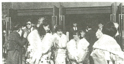
式も終って笑顔の新人