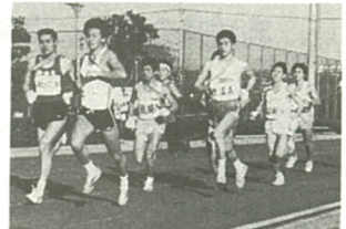
9チームそろってスタート

ボールを持ったことのない親がほとんどで、子供たちのゲームでは自陣ゴールに「トライ？」。するなどの珍プレーも。ゲーム後はおしるこや豚汁を食べながら、お互いの健康をたえ合い楽しい一日を過ごした。