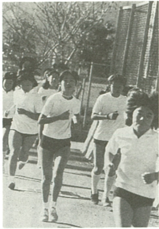
ランニングでストレスも解消

生きている間、人間の体は毎日休まず動いている。文明が未発達な時代はいろいろなことを人力でやり遂げていた。運動量はほんのわずかなもので、現代は、現代文明がもたらした交通手段や