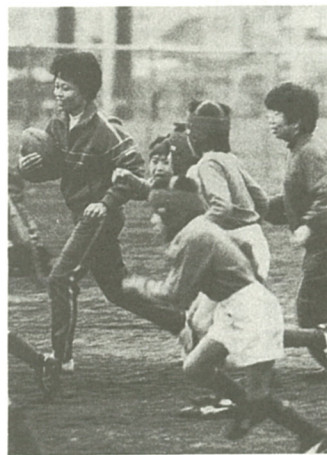
ガンバレ母さん！ほくらも負けなぞ

一月二十五日、小田急クラウンで「親子ラグビー交流会」が行われた。この交流会は、海老名ラグビースクール（佐々木