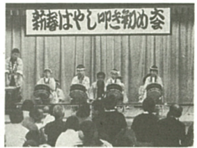
熱演に会場から拍手