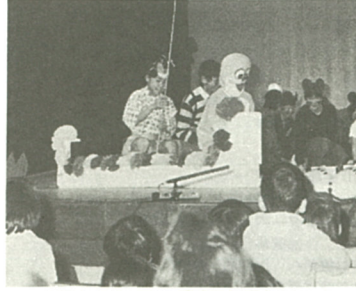
ドラえもんも登場し、楽しいひととき