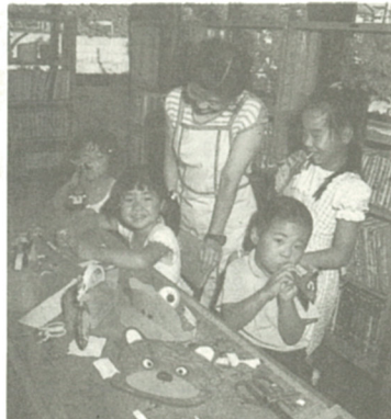
児童館で楽しい工作づくり(大谷児童館)

●内容 ペーパークラフト「雷ゴロちゃん」のモビール ●時間 ①午前9時~正午 ②午後1時~4時 ●対象・人員 小学生(低学年は保護者同伴)、各回とも60人(申し込み順) ●用意するものはさみ、物差し、木工用ボンド、千枚通しまたは目打ち ●申し込み・問い合わせ 社会教育課(内253)