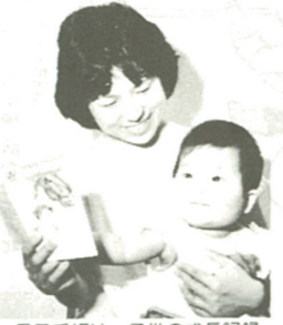
母子手帳は、子供の成長記録

母子健康手帳は、妊 娠中や産後のお母さん の健康を守り、おどろ き生まれてきた赤ちゃん の健康と健全な発育を 守るために作られたも のです。 また、この手帳は妊 娠の初めからお母さん が小学校に行き始める までのお母さんとおま の一生にわたる健康記 録となります。妊 娠・分娩・育児の要 点を記録し、必要に 応じて書いておいて ください。