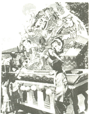
高さ2メートルの「ねぶた」が完成