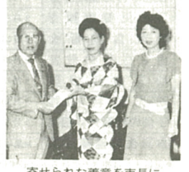
寄せられた善意を市長に