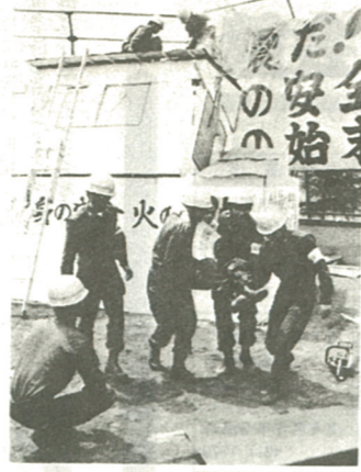
去年の防災訓練から

楽しみ、互に批評し合うことも多い。勉強といふこと。 絵は描くだけでなく、見てもらう。目的を定めよう。このため、水彩画OB会は来年二月に「マイ絵老名図」グループ展を開く予定だ。