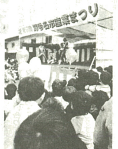
チェンジマンも登場

物花が展示されていて、感心しました。 新鮮な農産物や植木・花の即売、豚汁やお餅など楽しく、お腹もいっぱい。 そのうえお土産までいたつたという盛りだくさんの内容に大