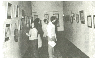
心のこもった作品がずらり

十一月一日から四日まで、市民文化祭が開かれました。会場の市文化会館のホールには丹精こめて作られたさまざまな菊や盆栽がずらりと並べられ、訪れた人々を歓迎してゐるかのようでした。