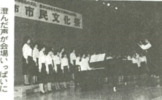
澄んだ声がかみいっばいに

出展部門では、日頃見ることのない詩吟や剣舞踊を知るものができました。出演者自身がの力をこめて、一つの舞台を作っていることに感動しました。