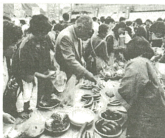
新鮮な野菜がいっぱい

早くから出かけ来た人も多かつたようです。 長蛇の列ができていたので、何かしら、と行つてみると謝恩特別市の整理券配布、さっそく列に加わりました。また、農産物品評会では見事な出来はえの野菜や果