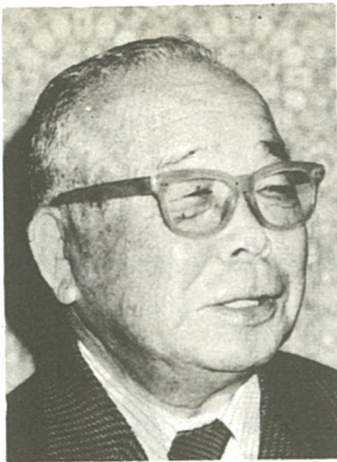
藍綬褒章を受章した