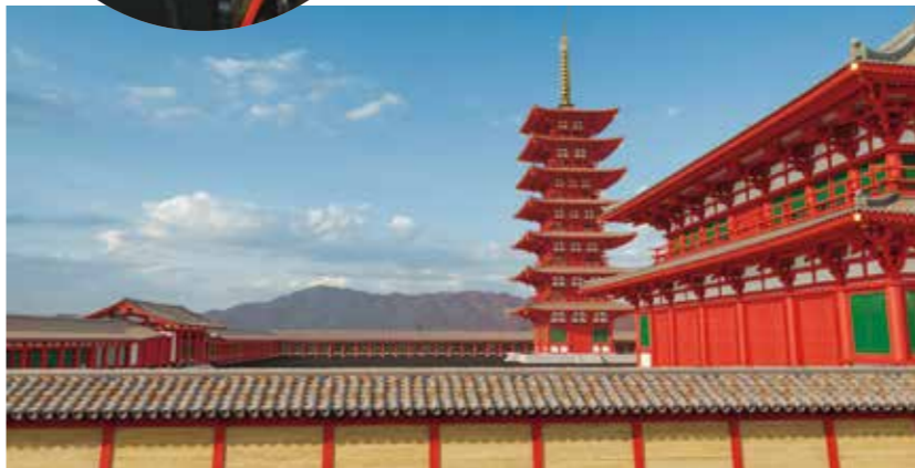
湘南工科大学 長澤研究室