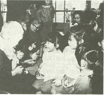
お手玉の遊び方を教えてもらう園児たち

年寄りたちは竹馬やお手玉などを実際に行い、園児も作業を手伝った。女の子に人気があったのがお手玉作りで、出来上がったお手玉の遊び方を年寄りにせがむ子も。また、男の子は竹馬や竹とんぼが完成すると、さっそく表に飛び出し試運転。するな