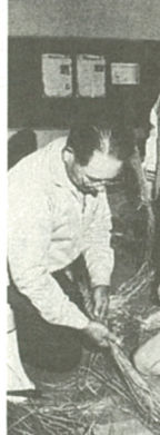
講師に手ほどきを受ける子供たち