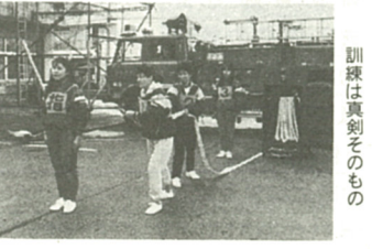
訓練は真剣そのもの

市内河原口の海老名厚生病院で女子自衛消防隊が結成され、市消防署職員の手授けを受け、室内消火栓訓練が行われた。訓練は十月二十七日から一月