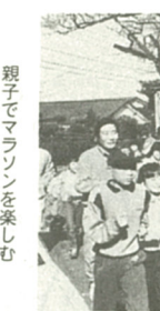
親子でマラソンを楽しむ