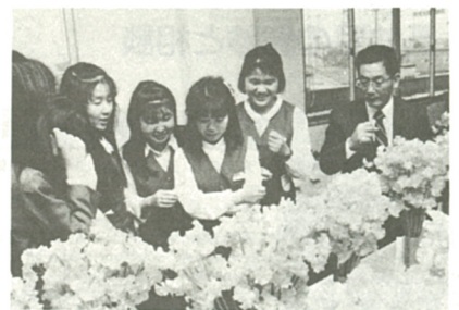
どれを買おうか目移りします

花き栽培農家の生産技術向上を目的とした「花き持ち寄り品評会」が、二月二十四日、一般公開のあと直売された花々が市価の半額とあって人気は上々。見事な出来栄に「どれを買おうか目移りしてしまっ」といった声も聞かれ、花々は短時間で売り切れ続出。