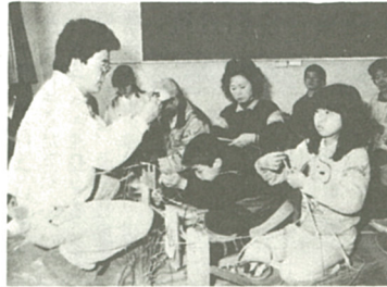
わらない作りで親子のふれあい

有馬でわらそり作り 二月二十一日、市消防署南分署で「わらそり作り」がわらそり作り