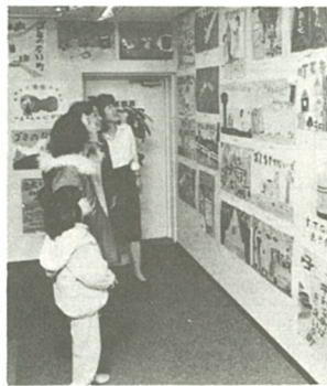
色彩豊かな作品がいっぱい

市内の児童三百人の作品を展示した「海老名市美化運動推進ポスター展」が、二月二十四日から五日間、二丁目五番名店文化ホールで開かれた。