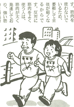
適度な運動の継続で50歳代でも40歳代の体力が維持できます

運動は、定期的に行うことが大切です。できれば毎日、少なくとも一日おきに運動するよう心掛けてください。激しいものは避け、手軽にできて長続きするスポーツを選びましょう。