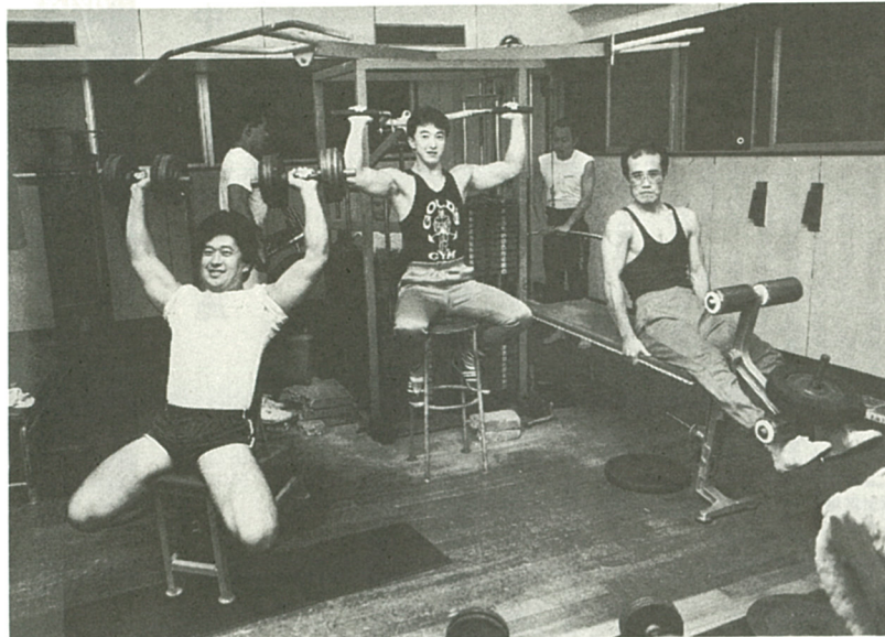
スポーツで汗を流し健康な毎日を…(県立厚木青少年会館で撮影)