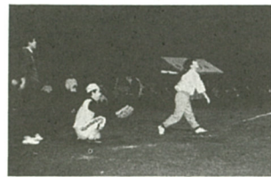
女性選手も好打でハッスルプレー

に頼り、「まち」を点と線で結ぶ動きのみで、「楽しいまち」に発展しないと思うのです。市の中心部に田んぼが残っているのは貴重な財産です。そこをゆくり散策できる道が整備され、所々にしゅれた休憩所があったりすれば、市中心部からや遠い駐車場からでも歩いてショッピングに向かうのではないのでしょうか。一度、原点にもどり、「人を大事にする道づくり」を将来のまちづくりに生かしてもらいたいものです。