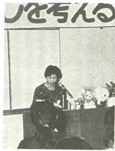
悪質商法を語る発表者

快晴に恵まれ十月十九日、小田急グラウンドで、市内小学校十三校が参加して連合運動会が開かれ、小学生約千八百人が参加した。この連合運動