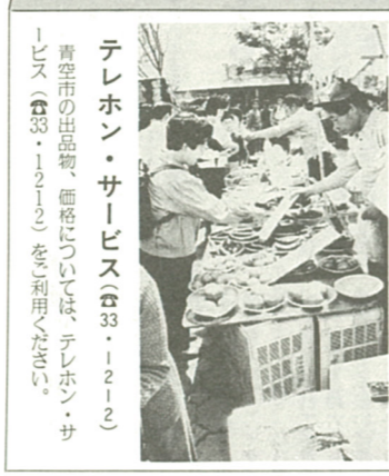
テレホン・サービス ☎33-1212 青空市の出品物、価格については、テレホン・サービス(☎33-1212)をご利用ください。

3日曜日を除く毎日朝7時から、市役所駐車場にて、今月の主な出品物は、ホウレン草、大根、ジャガイモ、サツマイモ、サトイモ、キャベツ、キウリ、ニンジン、ネギ、コボウ、ブロッコリー、カリフラワー、柿、鶏卵、鉢物など、季節物があふれます。出品に多少の変更があります。 なお、13日(日)の産菜まつりは中止ですが、青空市は市役所駐車場で開催します。