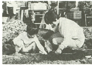
大きなおイモだね!