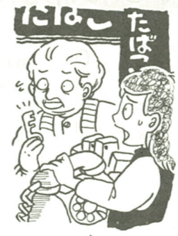
店頭にある赤(ピンク)電話 カギを開けてもらって119