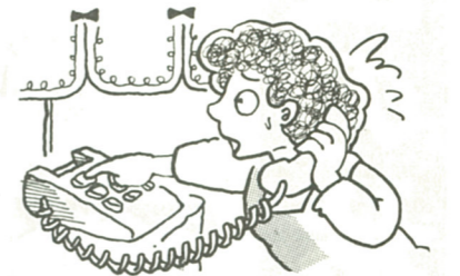
家庭用電話 受話器をとり、局番なしの119