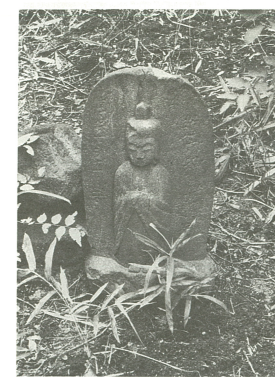
「海老名の道祖神」特別展