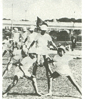
毎日練習した成果を見て

会は、全市の児童が一室に集い、演技や演技に参加し、広い視野と経験を持つと企画され、十一回目。種目は百回走や四