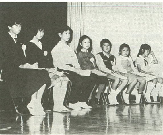
父親大会で作文を朗読した七人

図書館では、小さいお子さんとお母さんを対象に「母と子のおはなしひろば」を開いています。