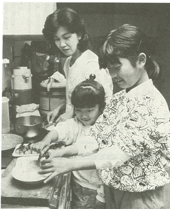
約6割の子供たちが積極的にお手伝いを...